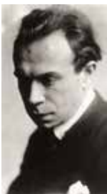
27 | ANONYME* R FOTOGRAF* IN Max Oppenheimer, um 1925 Fotografie Archiv Museum Langmatt, Stiftung Langmatt Sidney und Jenny Brown, Baden, Schweiz