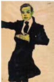
24 | EGON SCHIELE 1890–1918 Der Maler Max Oppenheimer, 1910 Aquarell, Tinte, schwarze Kreide auf Papier | 45,1 × 29,8 cm Albertina, Wien