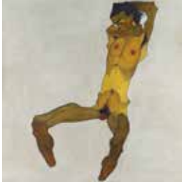
23 | EGON SCHIELE 1890–1918 Sitzender Männerakt (Selbstdarstellung), 1910 Öl, Deckfarbe auf Leinwand | 152,5 × 150 cm Leopold Museum, Wien