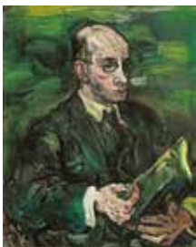
26 | OSKAR KOKOSCHKA 1886–1980 Hermann Schwarzwald II, 1916 Öl auf Leinwand | 79,1 × 63 cm Sammlung Broere Charitable Foundation Foto: Collection Broere Charitable Foundation © Fondation Oskar Kokoschka/Bildrecht, Wien 2023