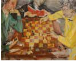
22 | MAX OPPENHEIMER 1885–1954 Schachpartie, 1953 Öl auf Leinwand | 85 × 102 cm Privatbesitz Leopold Museum, Wien