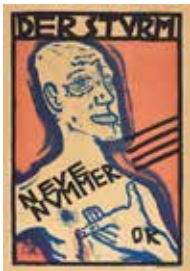
25 | OSKAR KOKOSCHKA 1886–1980 Plakat Der Sturm , 1910 Lithografie auf Papier | 71 × 47,3 cm Leopold Museum, Wien Foto: Leopold Museum, Wien Fondation Oskar Kokoschka/Bildrecht, Wien 2023