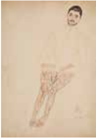
02 | ERWIN DOMINIK OSEN 1891–1970 Porträt eines Patienten, 1915 Aquarell, Bleistift auf Papier | 56,7 × 39,8 cm Leopold Museum, Wien