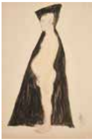
01 | ERWIN DOMINIK OSEN 1891–1970 Porträt eines Patienten, 1915 Aquarell, Bleistift auf Papier | 48,5 × 32 cm Leopold Museum, Wien