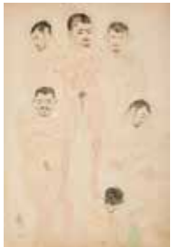
03 | ERWIN DOMINIK OSEN 1891–1970 Studien von Patienten, 1915 Aquarell, Bleistift auf Papier | 56,7 × 39,2 cm Leopold Museum, Wien