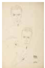
07 | ERWIN DOMINIK OSEN 1891–1970 Selbstporträt, 1915 Bleistift auf Papier | 52,7 × 33,2 cm Helen Emily Davy, Wien