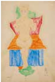
05 | ERWIN DOMINIK OSEN 1891–1970 Porträt eines*r Patienten*in („Lustknabe“), 1915 Aquarell, Bleistift auf Papier | 48,3 × 32,1 cm Leopold Museum, Wien