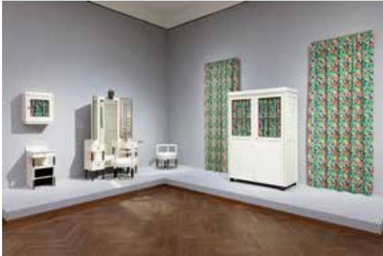
Exhibition view EMIL PIRCHAN. VISUAL REVOLUTION Leopold Museum, Vienna