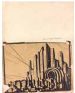
16 EMIL PIRCHAN 1884–1957

Vereinigte Kunstanstalten J. Bargou Söhne Nachf. Berlin Print on paper, 70,2 × 95,2 cm Theatermuseum, Vienna