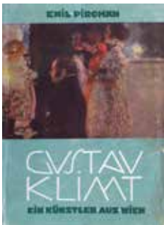
Photo: KHM-Museumsverband, Theatermuseum, Vienna © Emil Pirchan Estate, Steffan/Pabst Collection, Zurich

Watercolor, India ink, pencil on paper, 25,8 × 33 cm Theatermuseum, Vienna