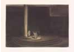
14 EMIL PIRCHAN 1884–1957

Lithograph on paper, 22,7 × 16 cm Leopold Museum, Vienna, donation Collection Steffan/Pabst © Emil Pirchan Estate, Steffan/Pabst Collection, Zurich, Zurich