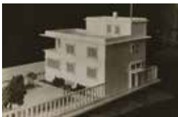
17 ANONYMER FOTOGRAF

India ink on tracing paper on paper support, 34,8 × 47,8 cm Theatermuseum, Vienna Photo: KHM-Museumsverband, Theatermuseum, Vienna © Emil Pirchan Estate, Steffan/Pabst Collection, Zurich