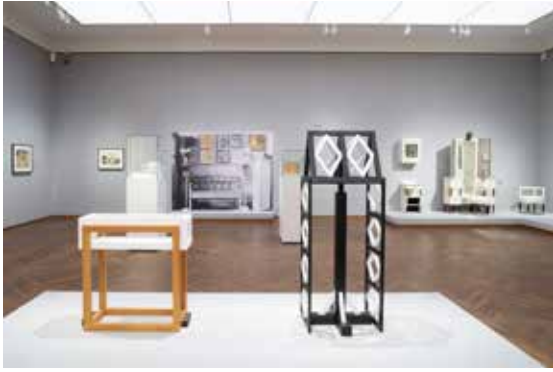
Ausstellungsansicht EMIL PIRCHAN. VISUELLE REVOLUTION Leopold Museum, Wien