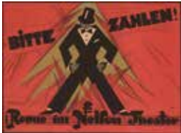
15 EMIL PIRCHAN 1884–1957

Charcoal on paper, 27,5 × 39,9 cm Theatermuseum, Vienna Photo: KHM-Museumsverband, Theatermuseum, Vienna © Emil Pirchan Estate, Steffan/Pabst Collection, Zurich