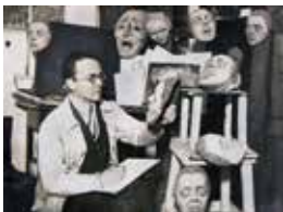
18 FOTOATELIER A. FRANKL, BERLIN

Photograph, 9,5 × 14 cm Steffan/Pabst Collection, Zurich Photo: Steffan/Pabst Collection, Zurich © Emil Pirchan Estate, Steffan/Pabst Collection, Zurich