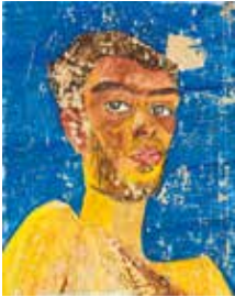
FRIEDENSREICH HUNDERTWASSER 1928–2000