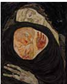
EGON SCHIELE 1890–1918