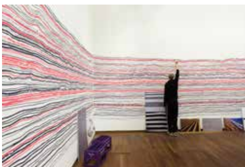
Ausstellungsansicht Hundertwasser – Schiele. Imagine Tomorrow