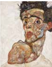
EGON SCHIELE 1890–1918