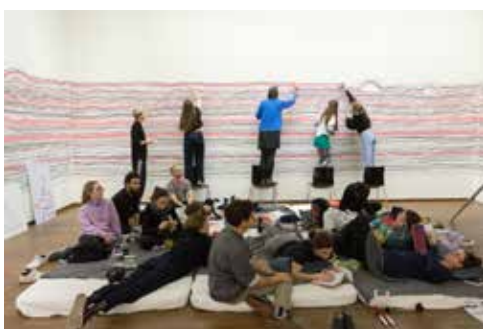
Exhibition view Hundertwasser – Schiele. Imagine Tomorrow