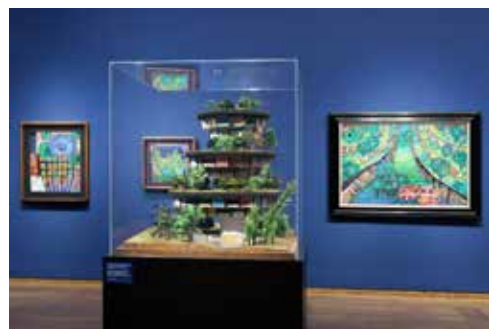
Ausstellungsansicht Hundertwasser – Schiele. Imagine Tomorrow