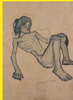
OSKAR KOKOSCHKA | Auf dem Rücken liegender Knabenakt mit angezogenen Knien. Savoyardenknabe, 1912 | Leopold Museum, Wien, Inv. 4668 | © Fondation Oskar Kokoschka/Bildrecht, Wien 2014 EGON SCHIELE | »Rote Bluse«, 1913 | Leopold Museum, Wien, Inv. 1433