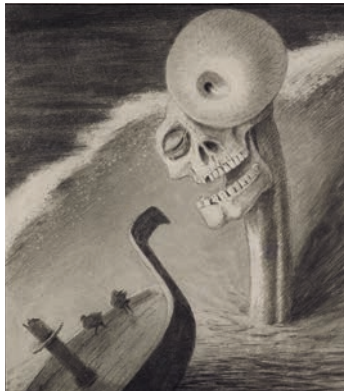
ALFRED KUBIN | »Das Grausen«, um 1902 Leopold Museum, Wien, Inv. 879