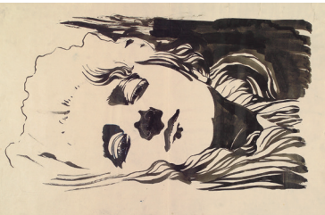
KOLOMAN MOSER | Allegorischer Frauenkopf. Bildnisstudie für die Umschlagvignette der 1. Gründermappe von Ver Sacrum , 1898/99 Leopold Museum, Wien, Inv. 2720

A drawn spatial intervention created especially for the exhibition by the contemporary artist Hannes Mlenek will provide a link to the present.