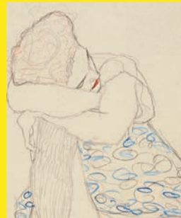
GUSTAV KLIMT | Sitzender weiblicher Halbakt in gemustertem Kleid, den Kopf auf das rechte Knie gestützt, 1910 (Detail) Leopold Museum, Wien, Inv. 1290

Eine für die Ausstellung konzipierte gezeichnete Raumintervention von Hannes Mlenek spannt schließlich den Bogen in die Gegenwart.