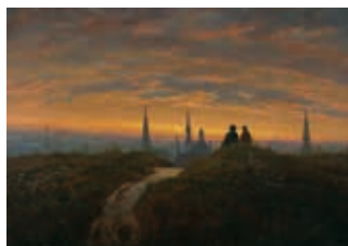
CARL GUSTAV CARUS 1789–1869

The Samuel Courtauld Trust, The Courtauld Gallery, London