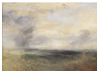
WILLIAM TURNER 1775–1851

Margate[?] vom Meer, um 1835–1840 Margate[?] from the Sea, c. 1835–1840