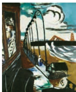
MAX BECKMANN 1884–1950

Strandpromenade in Scheveningen, 1928 Beach Promenade in Scheveningen