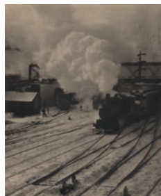
ALFRED STIEGLITZ (1864-1946)