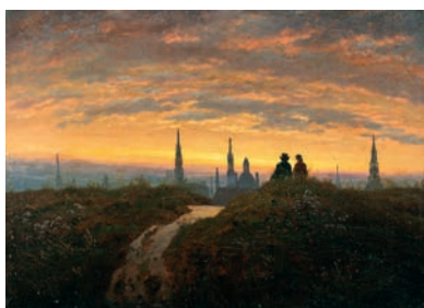
CARL GUSTAV CARUS (1789-1869)

The Samuel Courtauld Trust, The Courtauld Gallery, London