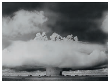
BRUCE CONNER (1933-2008)