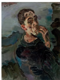
OSKAR KOKOSCHKA (1886-1980)

Selbstbildnis, eine Hand ans Gesicht gelegt, 1918/19