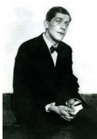
HUGO ERFURTH (1874-1948)