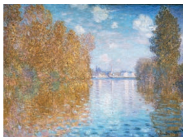
CLAUDE MONET (1840-1926)

Musée d'art et d'histoire, Ville de Genève