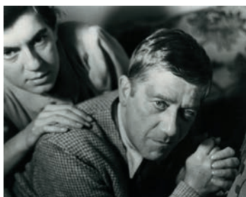
TRUDE FLEISCHMANN (1895-1990)