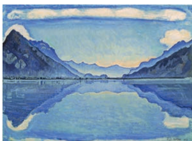
FERDINAND HODLER (1853-1918)

Der Thunersee mit symmetrischen Reflexen, 1909