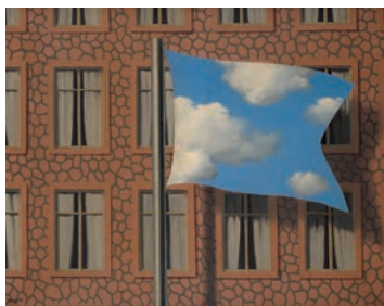
RENÉ MAGRITTE (1898-1967)

Fotogravure, 19,4 x 15,8 cm