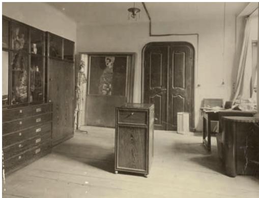
MORITZ NÄHR (1859-1945) Großer Vorraum zum Atelier Gustav Klimts in der Josefstädter Straße 21, 1912