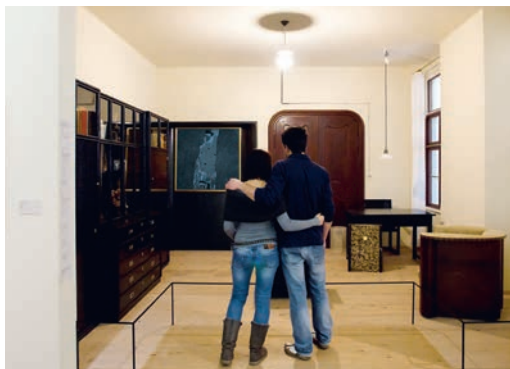
Einblick in den großen Vorraum zum »Atelier Gustav Klimts« in der »Wien 1900« Präsentation des Leopold Museum, 2012