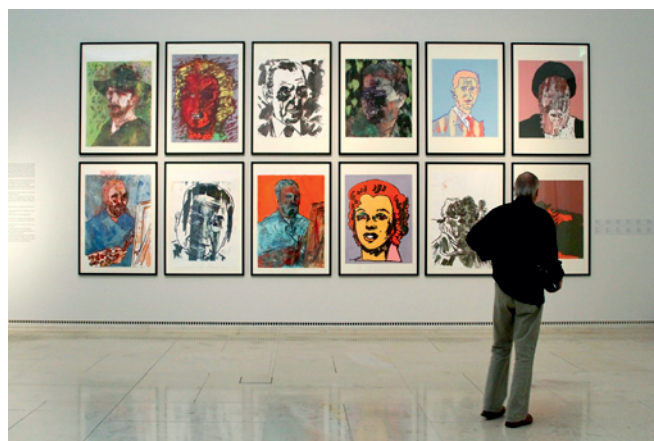
Leopoldovo muzeum, interiér