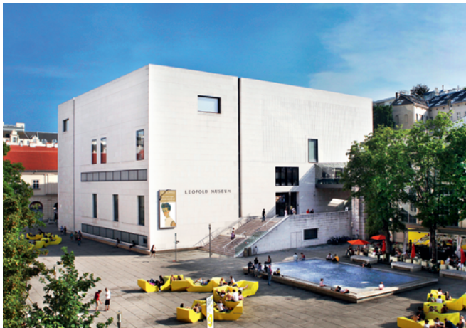
Leopoldovo muzeum, Vídeň