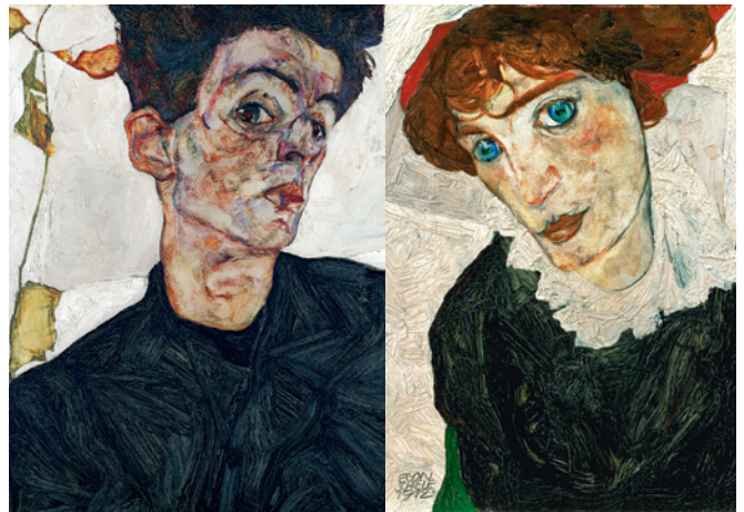
Egon Schiele, autoportrét (výřez), 1912