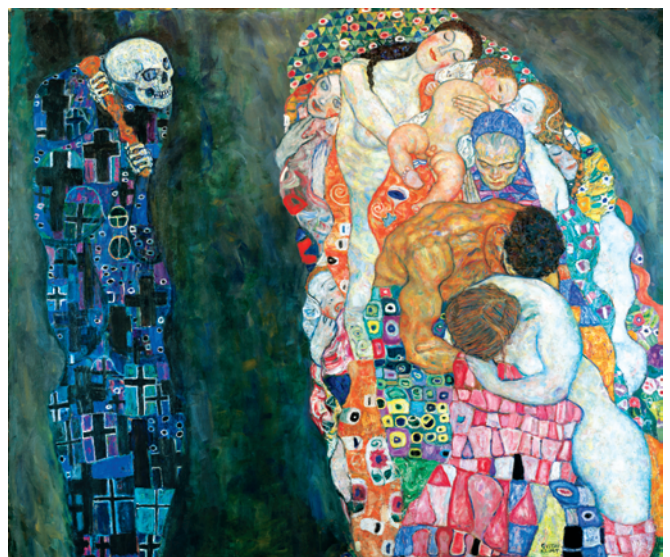
Gustav Klimt, Život a smrt (výřez), 1910/15

Leopoldovo muzeum představuje svým návštěvníkům některá z nejvýznamnějších mistrovských děl zakladatele secese Gustava Klimta, např. velkoformátový obraz „Smrt a život“, „Attersee“ nebo „Tichý rybník“. Gustav Klimt byl v roce 1897 spoluzakladatelem vídeňské Secese a jejím prvním předsedou. Má velký podíl na rozvoji mezinárodní secese ve Vídni v roce 1900. Jím vytvořené výrazové prostředky „čisté linie“ a nová forma pojetí udávaly hlavní směr nové generace malířů, k nimž patřili rovněž Oskar Kokoschka a Egon Schiele.