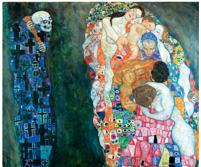
Gustav Klimt, La Vie et la Mort, 1910/15

Gustave Klimt fut en 1897 un des membres fondateurs de la Sécession viennoise et son premier président. À Vienne, Il contribua considérablement au développement international du Jugendstil autour de 1900. la « ligne pure » et les compositions novatrices développées dans ses travaux devinrent une référence pour la génération de peintres suivante, notamment pour Oskar Kokoschka et Egon Schiele.