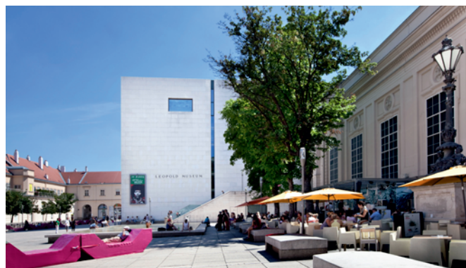
Musée Leopold, Vienne

Les fenêtres panoramiques situées au quatrième étage offrent une vue somptueuse sur le Hofburg et sur les toits du centre historique de Vienne.