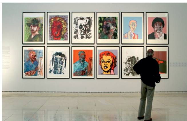
Musée Leopold, Vue intérieure