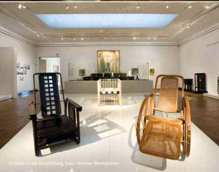
Einblick in die Ausstellung, Saal »Wiener Werkstätte«