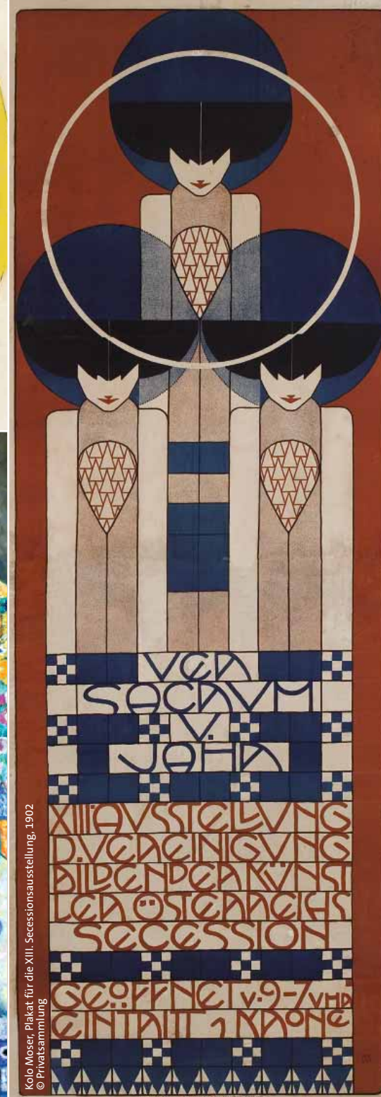
Kolo Moser, Plakat für die XIII. Secessionsausstellung, 1902