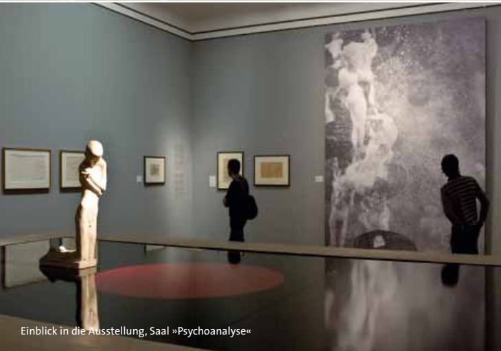
Einblick in die Ausstellung, Saal »Psychoanalyse«