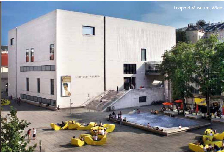
Leopold Museum, Wien