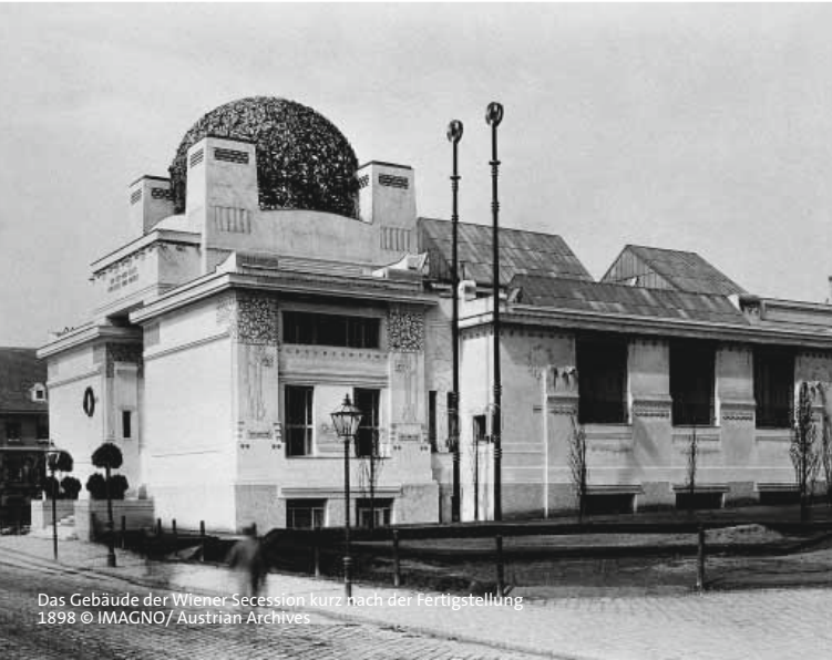
Das Gebäude der Wiener Secession kurz nach der Fertigstellung 1898