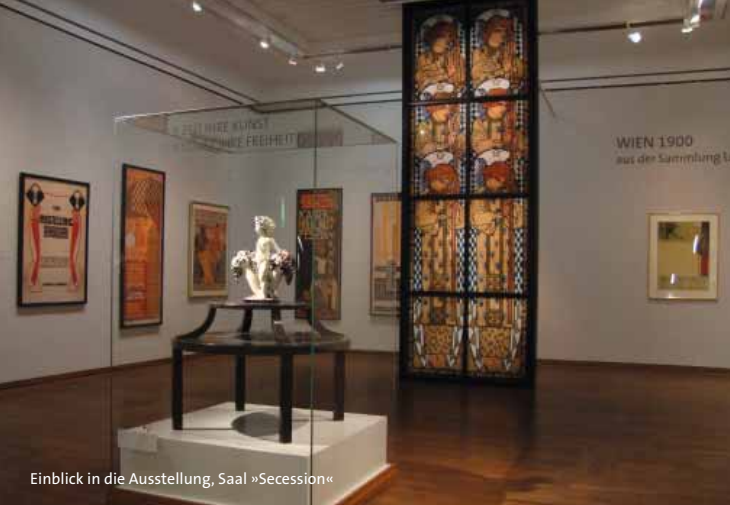
Einblick in die Ausstellung, Saal »Secession«