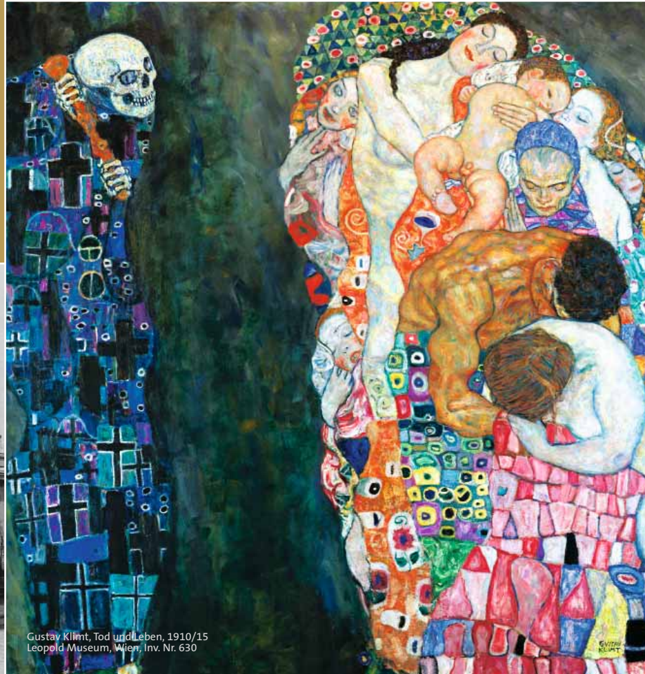
Gustav Klimt, Tod und Leben, 1910/15 Leopold Museum, Wien, Inv. Nr. 630