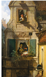
Foto | Photo: Leopold Museum/Lisa Rastl, Installationsansicht | Installation view Leopold Museum, Wien | Vienna © Bildrecht, Wien, 2017