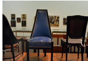
AUSSTELLUNGSANSICHT © Leopold Museum