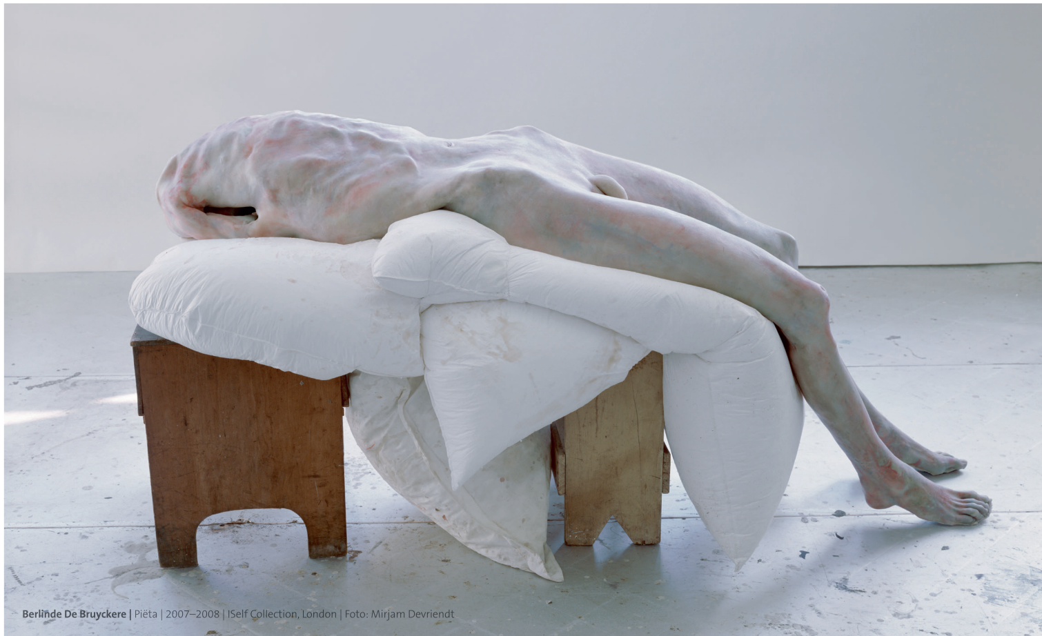
Berlinde De Bruyckere | Pieta | 2007–2008 | Self Collection, London | Foto: Mirjam Devriendt