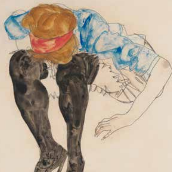
Egon Schiele | Blonde, vorgebeugt mit schwarzen Strümpfen | 1912 | Leopold Privatsammlung

Informationen unter: www.leopoldmuseum.org/de/vermietung