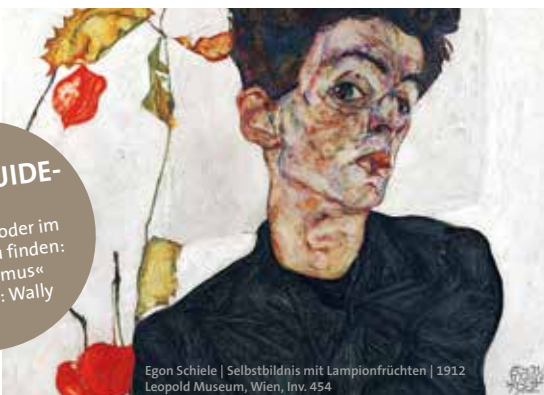
Egon Schiele | Selbstbildnis mit Lampenfrüchten | 1912 | Leopold Museum, Wien, Inv. 454