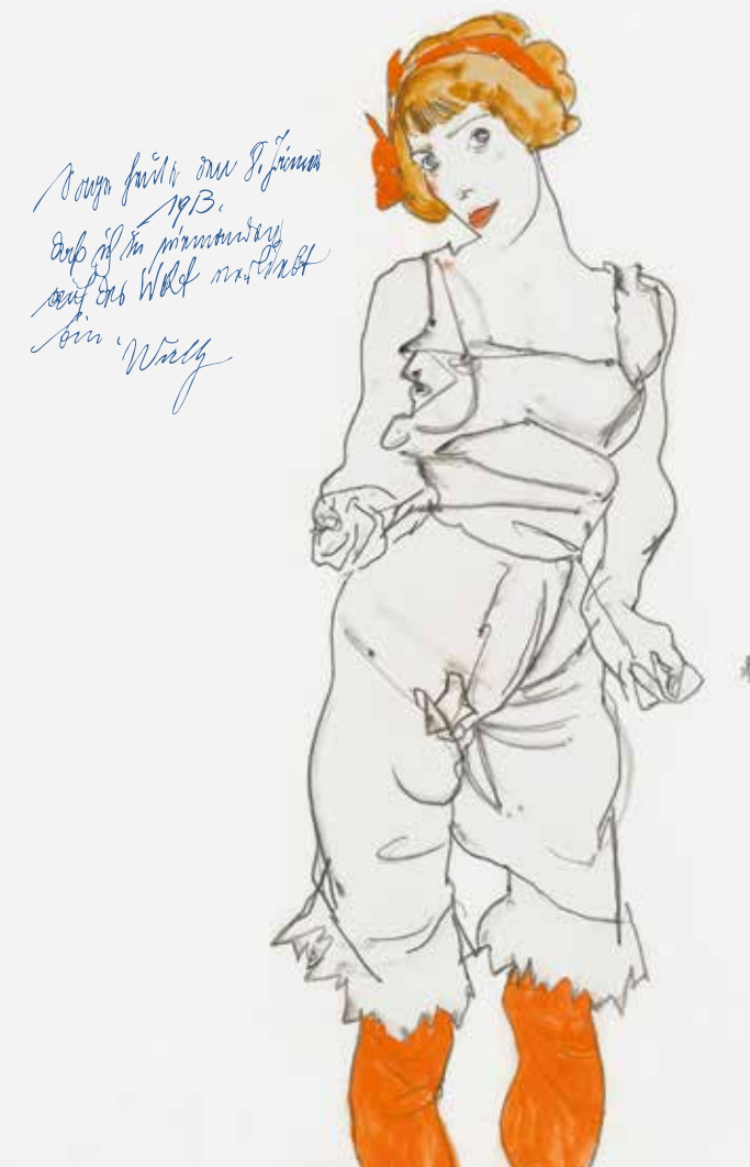
Cover: Egon Schiele | Frau in Unterväsche und Strümpfen (Wally Neuzil) | 1913 | Vermittlung Christe's

27.02. – 01.06.2015 WALLY NEUZIL Ihr Leben mit EGON SCHIELE