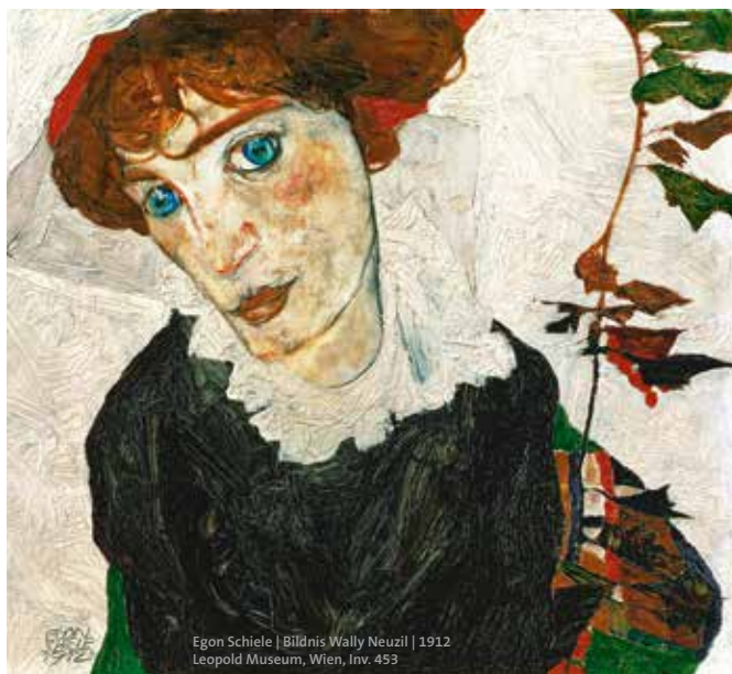
Egon Schiele | Bildnis Wally Neuzil | 1912 | Leopold Museum, Wien, Inv. 453

Im Museum oder im App-Store zu finden: »Hearonymus« Stichwort: Wally