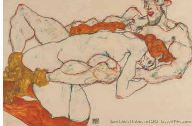
Egon Schiele | Liebespaar | 1913 | Leopold Privatsammlung

The exhibition explores the life of Walburga »Wally« Neuzil (1894–1917), the person behind the famous painting from the collection of the Leopold Museum. Numerous artworks, autographs, photographs and documents, many of which are shown for the first time, shed light on Wally's life and the time in which she lived.