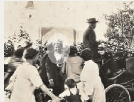
Gustav Klimt mit Pferdekutsche auf der Fahrt zum Bahnhof nach Vöcklabruck, im Hintergrund die Pfarrkirche von Seewalchen, 1913

Bereits im Jahr 2003 wurde Gustav Klimt am Attersee mit einem Themenweg gewürdigt. Anlässlich seines 150. Geburtstages am 14. Juli 2012 wurde das »Gustav Klimt-Zentrum« in prominenter Lage an der vom Künstler gemalten Schlossallee in Kammer am Attersee errichtet. Bis heute kann man einen Hauch dieser Atmosphäre vor Ort entdecken und sich persönlich auf Klimts Spuren begeben.