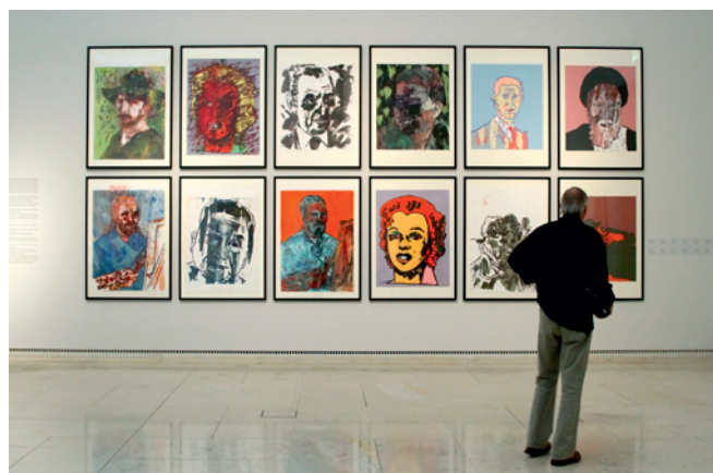
Leopold Múzeum belülről