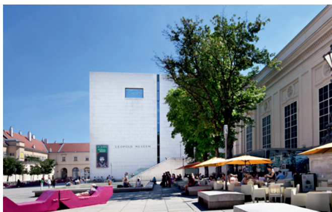
Leopold Múzeum, Bécs

2001-ben lélegzetelállító új múzeumépületet mutathatunk be: A Leopold Múzeum. A hatalmas, 24 méter magas fehér kocka az egykori udvari istállók területén kialakított új „ Múzeumnegyed “ kulturális és szabadidő központ főépületeként nyújtózkodik Bécs égboltja felé. Az építésznek, Ortner & Ortner-nek sikerült a Múzeumtéren, Rudolf Leopolddal együttműködve, egy örök eleganciájú monolitot felállítani. A nagy ablakok nagyszerű minőségű, fényel elárasztott kincsházzá teszik az épületet. A 19 méter magas, üveggel fedett átrium egyike a leglenyűgözőbb modern múzeumi belső térkialakításoknak. A negyedik emeleten található panorámaablakból csodálatos kilátás nyílik a császári palotára és a bécsi belváros háztetőire.