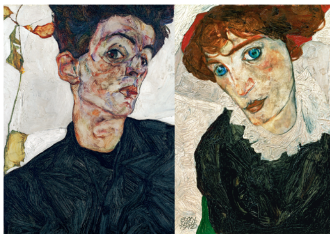
Egon Schiele, Autoportret, 1912