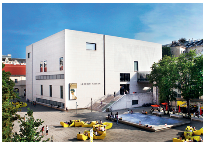
Muzeum Leopoldów, Wiedeń