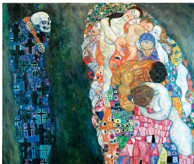
Gustav Klimt, „Śmierć i życie”, 1910/15

Muzeum Leopoldów prezentuje jedno z najbardziej znaczących dzieł twórcy secesji, Gustava Klimta, takie jak wielkoformatowe obrazy: „Śmierć i życie” („Tod und Leben”), „Attersee” czy „Spokojny staw” („Stiller Weiher”). Gustav Klimt był w 1897 jednym z twórców Wiedeńskiej Secesji i jej pierwszym przewodniczącym. Znacząco przyczynił się do rozwoju międzynarodowego Jugendstilu w Wiedniu około roku 1900.