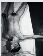
RUDOLF SCHWARZKOGLER (Wien 1940 – 1969 Wien) 3. Aktion 1965, Abzug für Archivio Conz Verona 1972/73, Foto Ludwig Hoffenreich, 1965 3 rd Action 1965, print for Achivio Conz Verona, 1972/73, photograph Ludwig Hoffenreich Fotografie / Photograph 23,5 x 17,5 cm Privatsammlung, Wien Private Collection, Vienna