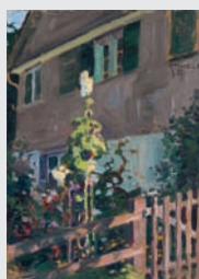
EGON SCHIELE (Tulln 1890 – 1918 Wien) Blühende Malven vor Hauswand (»Aus Bregenz«), 1907 Flowering Malva in Front of a Wall (»From Bregenz«) Öl auf Karton Oil on cardboard 24,8 x 17,8 cm Privatbesitz / Private Collection