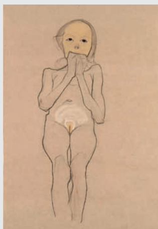
EGON SCHIELE (Tulln 1890 – 1918 Wien)