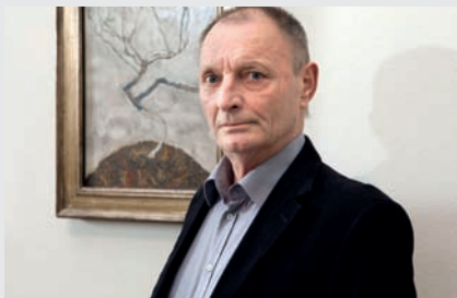
GÜNTER BRUS, 2011