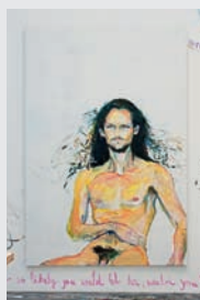
ELKE KRISTUFEK (* Wien 1970, lebt und arbeitet in Wien und Berlin) Ein Auftragswerk, 2009 Commissioned Work Acryl auf Leinwand Acrylic on canvas 300 x 200 cm