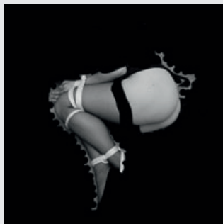
FRANZ GRAF (Tulln 1954 - *)