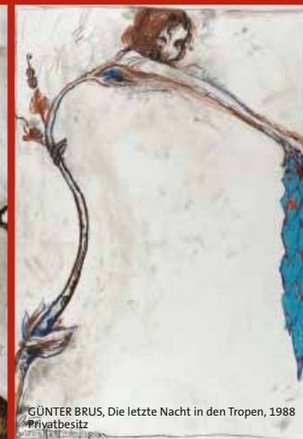
GÜNTER BRUS, Die letzte Nacht in den Tropen, 1988 Privatbesitz