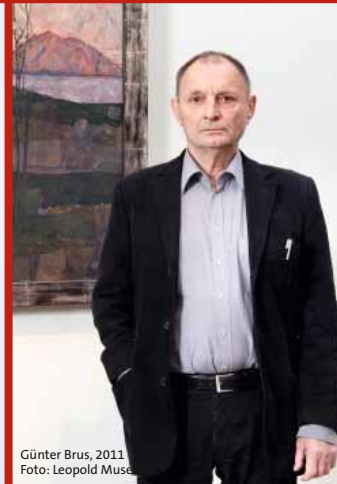
Günter Brus, 2011