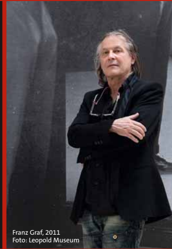
Franz Graf, 2011