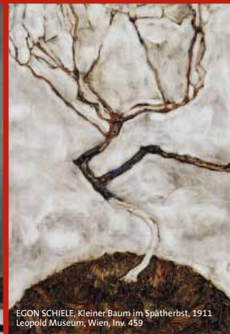
EGON SCHIELE, Kleiner Baum im Spätherbst, 1911 Leopold Museum, Wien, Inv. 459