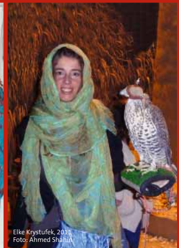
Elke Krystufek, 2011