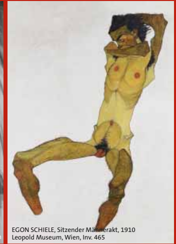
EGON SCHIELE, Sitzender Männerakt, 1910 Leopold Museum, Wien, Inv. 465